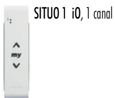
SITUO 1 iO, 1 canal