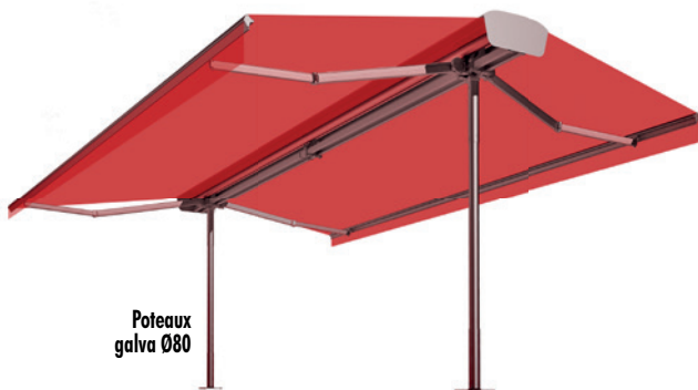
Poteaux galva Ø80

Réglages séparés et fonctionnement synchronisé Les 2 toiles doivent être ouvertes et fermées simultanément L'écart entre les 2 avancées ne doit jamais excéder 1000 mm