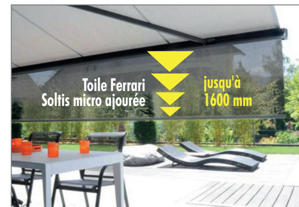
Toile Ferrari Soltis micro ajourée