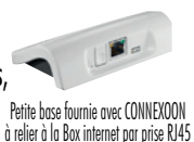
Petite base fournie avec CONNEXOON à relier à la Box internet par prise RJ45

CONNEXOON : un ou plusieurs stores, avec toutes leurs options, commande à distance avec smartphone ou tablette