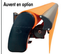
Auvent en option