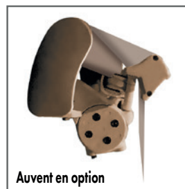
Auvent en option